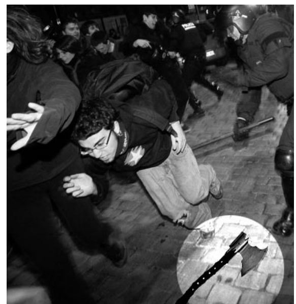
Amb aquesta destal, els antisistema pretenien trencar el cordó policial i arribar a plaça St Jaume per tal d'ocupar el palau de la Generalitat, i instaurar l'anarquia.