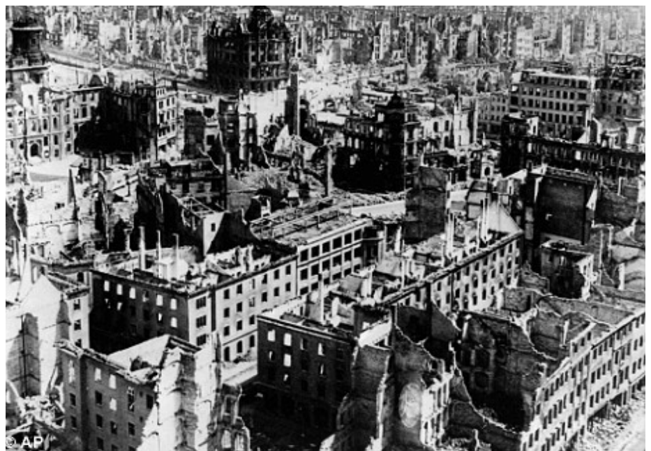
Maqueta d'una ciutat de la civilització Occidental a 30 anys vista.

L'home, com deiem, ha estat doncs el primer animal domèstic. Però com també deiem en un principi, tot i aquest inici tan llunyà de la seva domesticació, aquest és un procés encara no terminat. L'home, al més profund del seu cervell, manté els seus instints animals salvatges. La seva principal aspiració ha estat ser lliure i així ho ha demostrat al llarg de la història, en revoltes, en buïllagues, en fugides de la realitat . ■