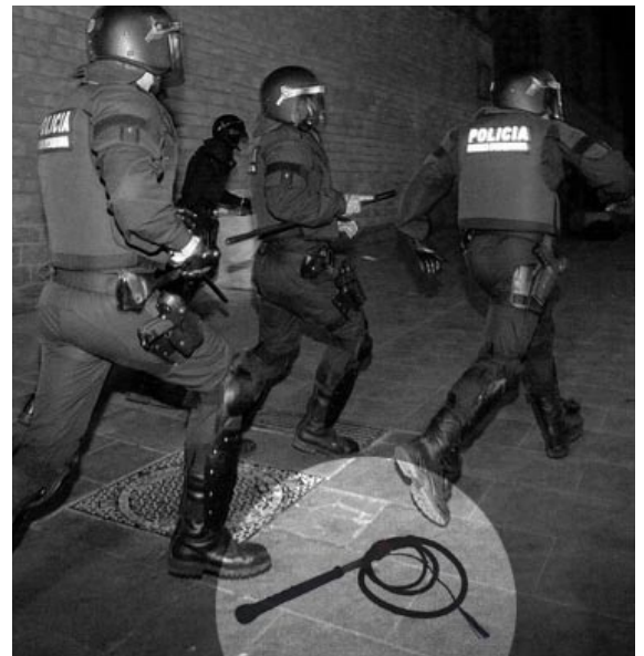
Aquí podem apreciar el fuet sadomasoquista amb què un antisistema va fuetejar lascivament a un mossos d'esquadra.

Després d'haver descobert el martell que va contusionar a un periodista, els mossos aporten més proves de la violència que van utilitzar els violents antisistema infiltrats entre els manifestants anti-bolonya per tal de justificar la violència que van utilitzar ells. El servei "d'intel·ligència" dels mossos d'esquadra ha estat analitzant exhaustivament totes les imatges enregistrades sobre la càrrega policial i ha presentat un informe revelant les múltiples armes que van utilitzar els antisistema, del qual us oferim dos exemples: