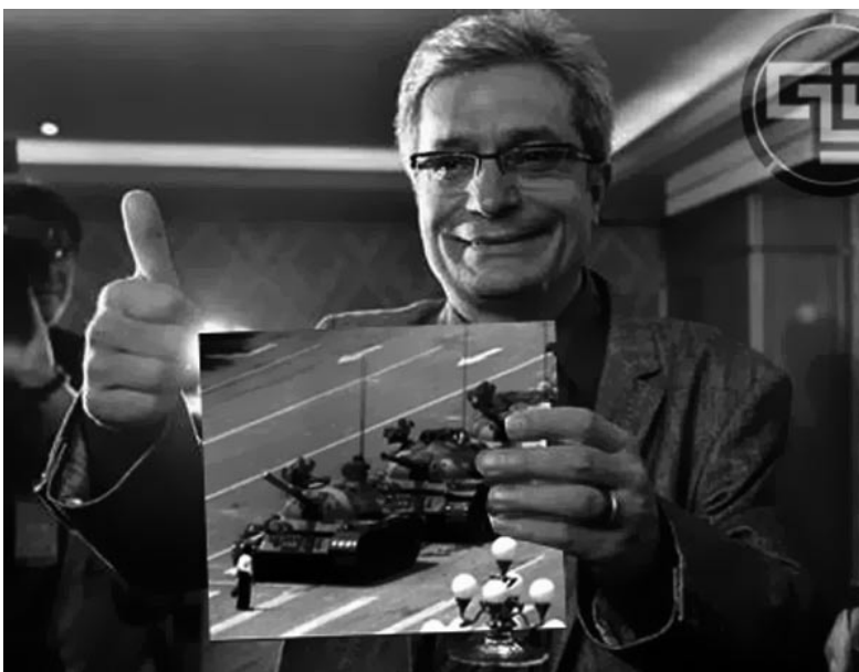
El conseller mostra davant les càmeres la imatge més famosa de la massacre de Tiananmen.